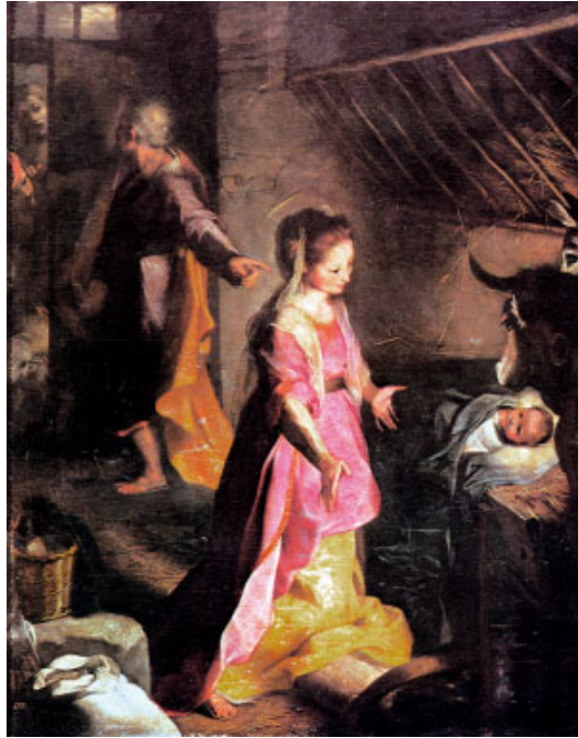
Santa Maria contemplat el seu fill Jesús. Pintura de Barocció, Museu del Prado, Madrid

Al cumplirse los ocho días tocaba circumcidar al niño, y le pusieron por nombre Jesús, como lo había llamado el ángel antes de su concepción.