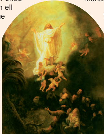
Ascensió del Senyor. Pintura de Rembrandt, Alte Pinakothek, Munic (Alemanya)

Que és rei de tot el món, / canteu a Déu un himne. / Déu regna sobre les nacions, / Déu seu al tron sagrat. R.