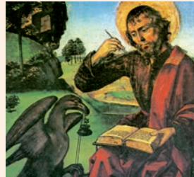
Sant Joan Evangelista (Fragment del seu evangeli aquest diumenge). Pintura de Berruguete, Capella Reial (Granada)

Anuncia su palabra a Jacob, / sus decretos y mandatos a Israel; / con ninguna nación obró así, / ni les dio a conocer sus mandatos. R.