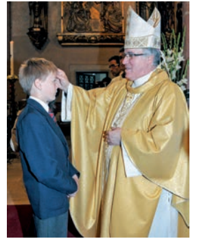
Confirmació d'alumnes de Viaró

Confirmacions. El Temps de Pasqua sol ser temps de celebració del sagrament de la Confirmació. A la Catedral, Mons. Josep Àngel Saiz ha confirmat grups d'alumnes d'aquests col·legis: Viaró de Bellaterra (24 d'abril); La Vall, de Bellaterra (29 d'abril); El Pinar, de Valldoreix (6 de maig); La Farga, de Sant Cugat del Vallès (13 i 14 de maig); Puresa de Maria, de St. Cugat del Vallès (18 de maig). També a la catedral, Mons. Salvador Cristau ha administrat el sagrament de la Confirmació a alumnes dels col·legis: La Vall, de Bellaterra (30 d'abril); Gresol, de Terrassa (5 de maig); Immaculat Cor de Maria, de Sentmenat (30 de maig).