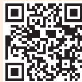
Accés al Breviari