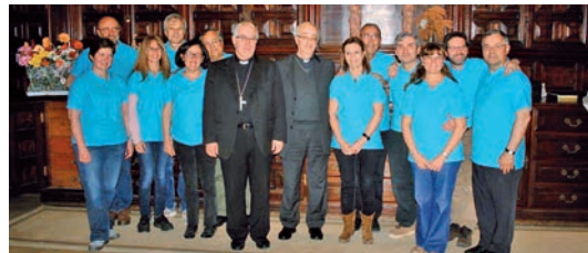
El Sr. Bisbe i el Sr. Bisbe auxiliar amb els components de la Delegació Episcopal de Pastoral Familiar

Confirmacions. El Temps de Pasqua sol ser temps de celebració del sagrament de la Confirmació. A la Catedral, Mons. Josep Àngel Saiz ha confirmat grups d'alumnes d'aquests col·legis: Viaró de Bellaterra (24 d'abril); La Vall, de Bellaterra (29 d'abril); El Pinar, de Valldoreix (6 de maig); La Farga, de Sant Cugat del Vallès (13 i 14 de maig); Puresa de Maria, de St. Cugat del Vallès (18 de maig). També a la catedral, Mons. Salvador Cristau ha administrat el sagrament de la Confirmació a alumnes dels col·legis: La Vall, de Bellaterra (30 d'abril); Gresol, de Terrassa (5 de maig); Immaculat Cor de Maria, de Sentmenat (30 de maig).