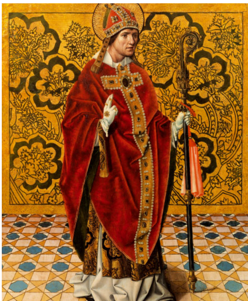
Sant Gregori (1500), de Juan de Nalda. Museu del Prado, Madrid (Espanya)

Sant Gregori farà de pont entre dos mons culturals diversos. Ell, que procedeix de la romanitat, haurà d'educar els bàrbars d'Occident, que són cristianitzats massivament. És el veritable catequista dels pobles d'Europa. Interpreta l'Esclatadura com a història de la salvació, com a paradigma de la salvació que es fa actual en l'Església i en cada un dels cristians. Allò que succeeix històricament en l'Esclatadura, es realitza també místicament en el fidel. A més, la lectio divina ,