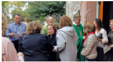
tiu dels 25 anys de la Festa de la Gent Gran de Campins.

Dissabte 3, a les 12 h. Assemblea diocesana de Mans Unides a la seu de Càritas Diocesana, a Sabadell.