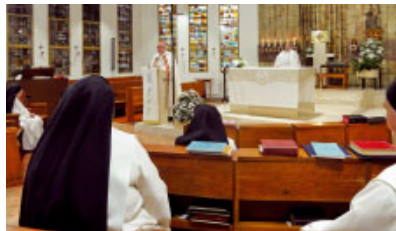
Vespres a les Dominiques de Sant Cugat. El diumenge 7 d'octubre s'esqueia la memòria de la Mare de Déu del Roser. Amb aquest motiu Mons. Saiz Meneses presidí la celebració de les Vespres al Monestir de Sant Domènec (Dominiques) de Sant Cugat del Vallès.

Romeria de Terrassa a Montserrat. El diumenge 7 d'octubre, les parròquies de l'Arxiprestat de Terrassa varen anar en romeria al Santuari de la Mare de Déu de Montserrat. Hi participaren més de 300 persones entre joves i adults. L'acte central fou la Missa, a les 5 de la