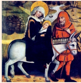
La fugida a Egipte. Pintura del s. xv, Museu Nacional de Cracòvia

Esta es la bendición del hombre / que teme al Señor. / Que el Señor te bendiga desde Sió, / que veas la prosperidad de Jerusalén / todos los días de tu vida. R.