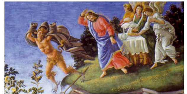
Les temptacions de Crist (1481-1482) de Sandro Botticelli. Capella Sixtina, Ciutat del Vaticà, Roma (Itàlia)