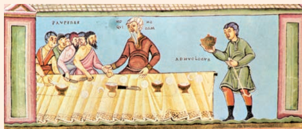
Paràbola del rei al convit de noces. Evangeliari d'Echternach (s. X), Museu Nacional de Nuremberg

En aquel tiempo, de nuevo tomó Jesús la palabra y habló en parábolas a los sumos sacerdotes y a los ancianos del pueblo: «El reino de los cielos se parece a un rey que celebraba la boda de su hijo. Mandó criados para que avisaran a los convidados a la boda, pero no quisieron ir. Volvió a mandar criados, encargándoles que les dijeran: "Tengo preparado el banquete, he matado terneros y reses cebadas, y todo está a punto. Venid a la boda." Los convidados no hicieron caso; uno se marchó a sus tierras, otro a sus negocios; los demás echaron mano a los criados y los maltrataron hasta matarlos. El rey montó en cólera, envió sus tropas, que acabaron con aquellos asesinos y prendieron fuego a la ciudad. Luego dijo a sus criados: "La boda está preparada, pero los convidados no se la merecían. Id ahora a los cruces de los caminos, y a todos los que encontréis, convidadlos a la boda." Los criados salieron a los caminos y reunieron a todos los que encontraron, malos y buenos. La sala del banquete se llenó de comensales.»