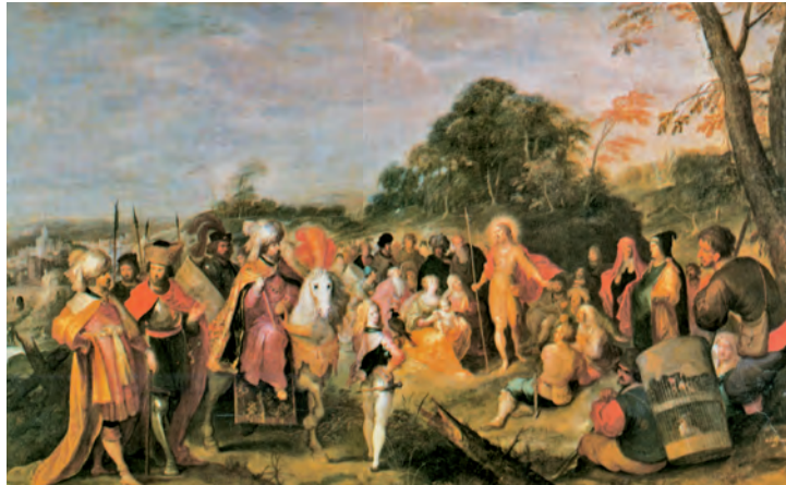
Gent de tota condició escoltant la predicació de Joan Baptista. Pintura de Franken, Museu del Prado (Madrid)

Canteu al Senyor que ha fet coses glorio- ses. / Que ho publiquin per tota la terra. / Poble de Sió, aclama'l ple de goig, / perquè el Sant d'Israel / és gran a la teva ciutat. R.