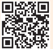
Accés al Breviari