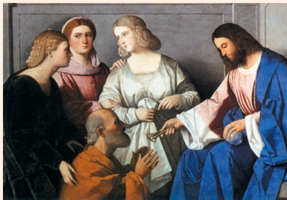
Jesús lliura les claus a sant Pere, pintura de Vincenzo di Biagio Catena (c. 1470-1531)

El Señor es sublime, se fija en el humilde, / y de lejos conoce al soberbio. / Señor, tu misericordia es eterna, / no abandones la obra de tus manos. R.