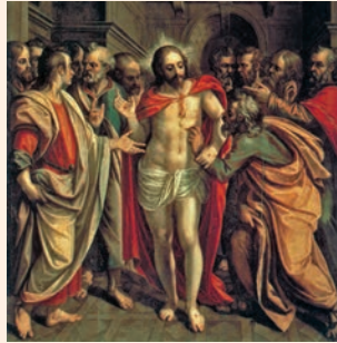
La incredulitat de Sant Tomàs. Pintura d'A. Sánchez Coello, Museu de la Catedral de Segòvia

La piedra que desecharon los arquitectos / es ahora la piedra angular. / Es el Señor quien lo ha hecho, / ha sido un milagro patente. / Este es el día en que actuó el Señor: / sea nuestra alegría y nuestro gozo. R.