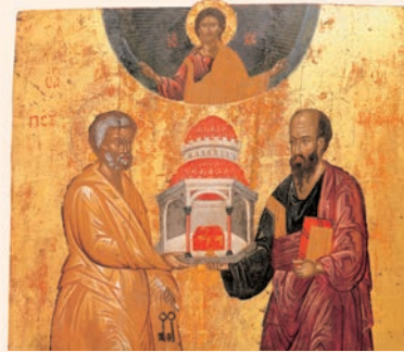
Jesucrist amb els apòstols Pere i Pau (detall). Icona de Creta (segle XVI), Museu del Louvre (París)

Jesús le respondió: «¡Dichoso tú, Simón, hijo de Jonás!, porque eso no te lo ha revelado nadie de carne y hueso, sino mi Padre que está en el cielo. Ahora te digo yo: Tú eres Pedro, y sobre esta piedra edificaré mi Iglesia, y el poder del infierno no la derrotará. Te daré las llaves del reino de los cielos; lo que ates en la tierra, quedará atado en el cielo, y lo que desates en la tierra, quedará desatado en el cielo.»