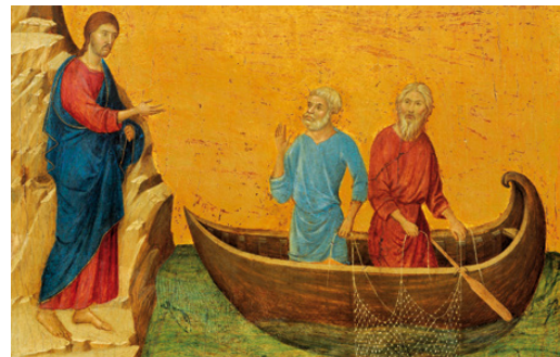
Vocació dels apòstols Pere i Andreu (1308-1311). Retaule de la Maestà de Duccio di Buoninsegna. Museu de la catedral de Siena (Itàlia)