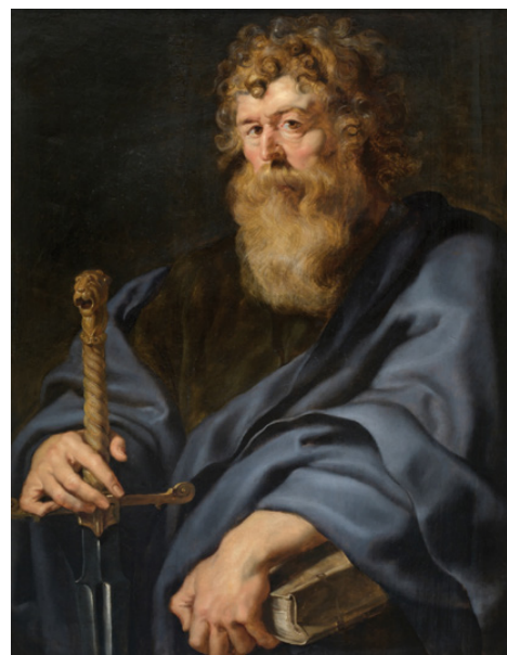
Sant Pere i Sant Pau (1610-1612), de Rubens. Museu Nacional del Prado, Madrid (Espanya)

serve per a compartir en comú la taula amb els altres creients no jueus d'origen. Finalment es va decidir no obligar a complir el ritu de la llei de Moisès, però es van indicar una sèrie de normatives mínimes per a assegurar la convivència en la celebració de l'Eucaristia.