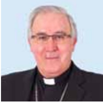
† Josep Àngel Saiz Meneses Obispo de Terrassa

D oce años de vida diocesana nos ayudan a tener una mirada agradecida hacia Dios por los frutos que se van dando en nuestra diócesis. Gracias a la colaboración de muchas personas podemos hacer llegar el amor de Dios a los más pobres y necesitados a través de Cáritas, que dispone de una red de cerca de 2.000 voluntarios y muchos colaboradores que dan soporte con su ayuda económica y que hace que a través de las 123 parroquias de la diócesis se haya atendido y acompañado el año pasado a casi 100.000 personas que sufren el azote de una crisis económica persistente.